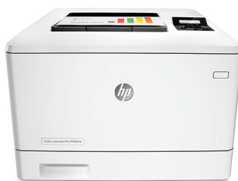
HP LaserJet Pro M452dn

Ideální tiskový výkon a silné zabezpečení odpovídající způsobu vaší práce. Tato výkonná barevná tiskárna dokončí tiskové úlohy rychleji a je vybavena ucelenými funkcemi zabezpečení na ochranu před hrozbami. 1 Originální tonerové kazety HP s technologií JetIntelligence vytisknou více stránek. 2