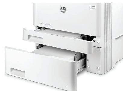
HP LaserJet Pro M452dn s volitelným zásobníkem na 550 listů