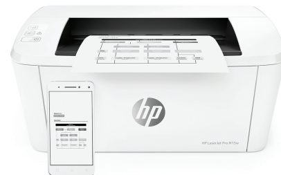
Tiskárna HP LaserJet Pro M15w